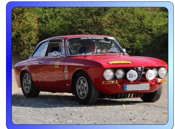
Die 2. Indeland Herbstfahrt ist ein Wertungslauf zum Euregio-Classic-Cup 2020